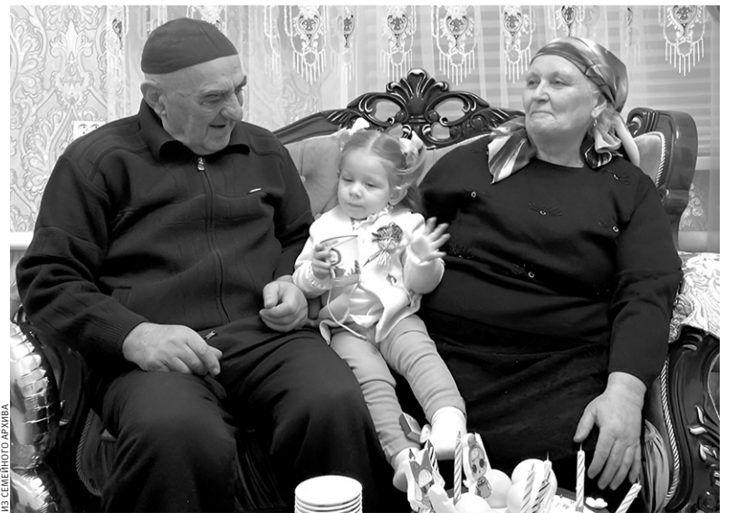
Внуки и правнуки — это наше продолжение, считают Кечеруковы