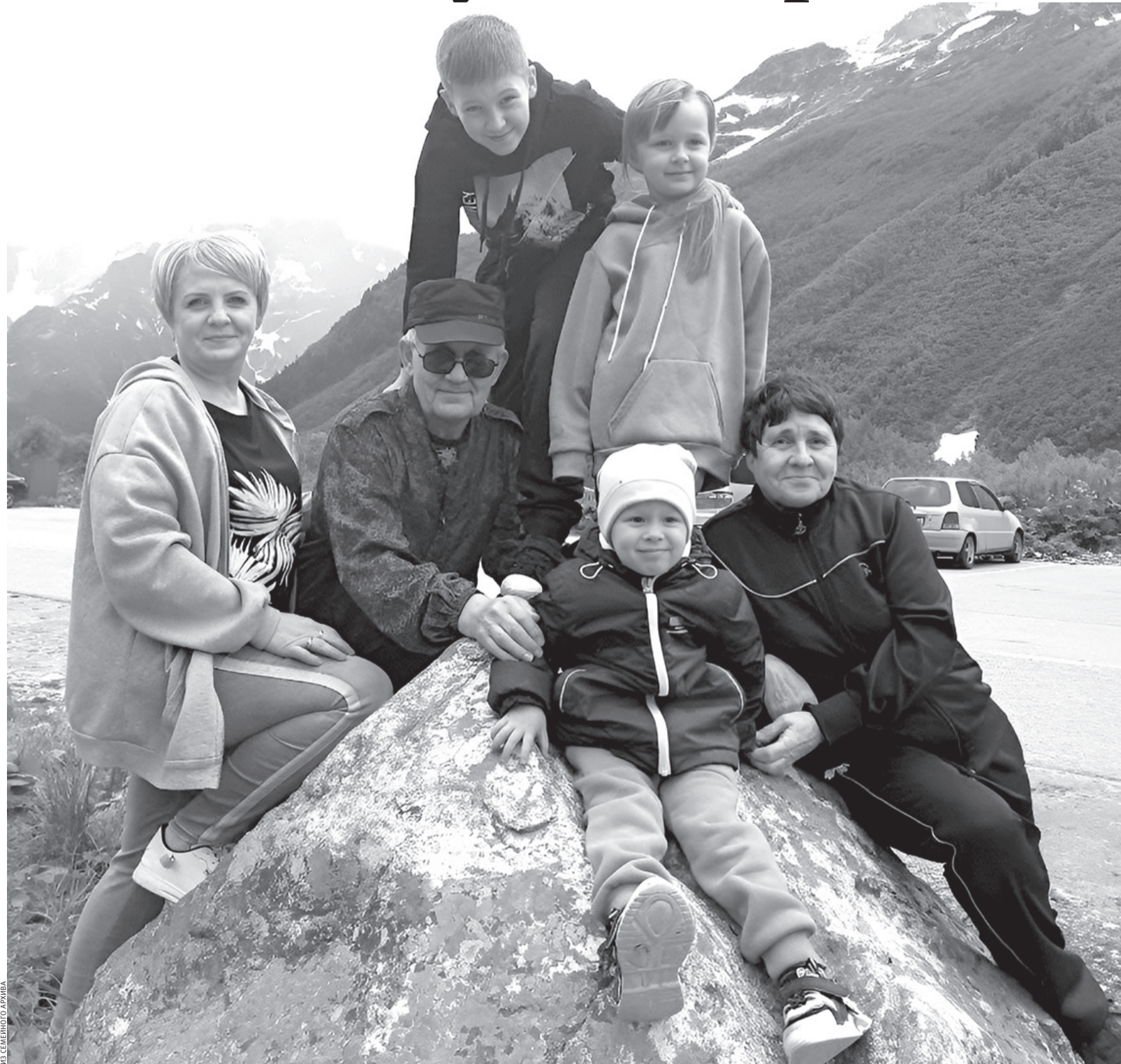
Супруги Ермошины любят путешествовать вместе с детьми и внуками